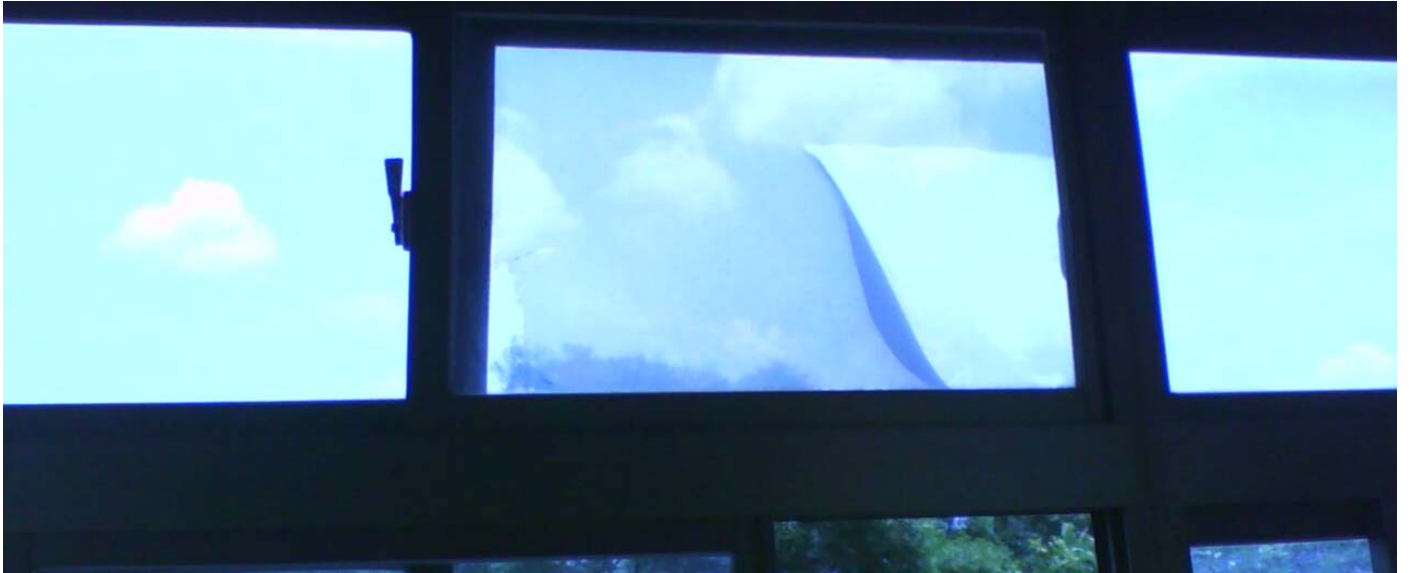
圖 1 損壞的紗窗

一位有出席會議的大老向我招手示意，我走向他之後，他立即對我指著圖1的氣窗上的紗窗對我說：「你看，我們早期都有裝上紗窗，但是風吹之後全部損壞了，這樣就不要再做了，取消這個提案吧。」